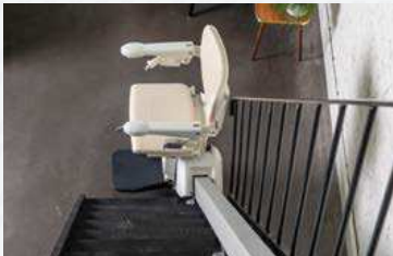
Besonders schlankes und platzsparendes Schienensystem