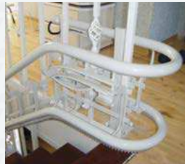
Befestigung an der Treppenharfe