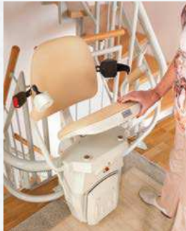
Armlehnen, Sitz und Fußstütze sind mit nur einer Handbewegung platzsparend klappbar