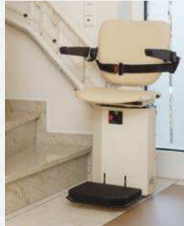
Befestigung an der anliegenden Wand