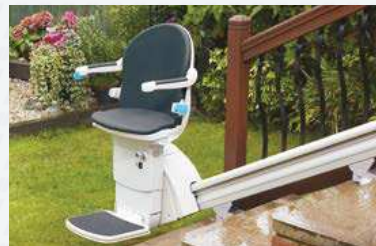
Die verdeckte Zahnstange ist extrem langlebig und kommt damit auch für Installationen im Außenbereich in Frage