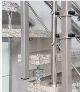
Befestigung an den Stufenbolzen