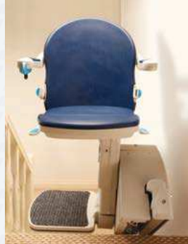
Drehbarer und platzsparender Komfortsitz