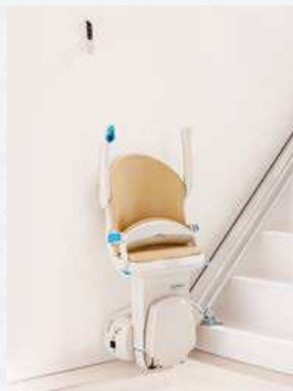
Platzsparender Komfortsitz und einfache und sichere Steuerung